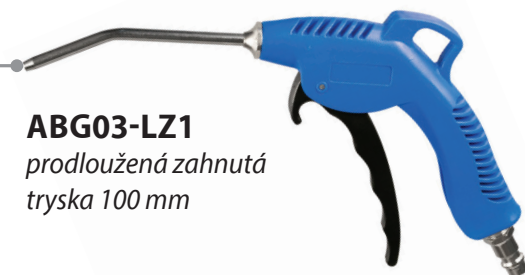
ABG03-LZ1 prodloužená zahnutá tryska 100 mm

Dlouhá zahnutá tryska umožňuje lepší dosah a ofukování v úzkých prostorech