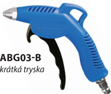
ABG03-B krátká tryska

Dlouhá zahnutá tryska umožňuje lepší dosah a ofukování v úzkých prostorech