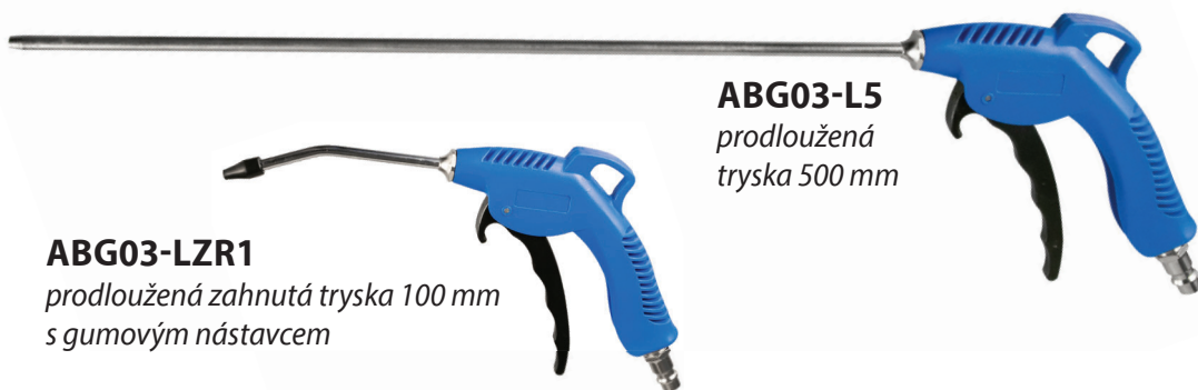
ABG03-L5 prodloužená tryska 500 mm